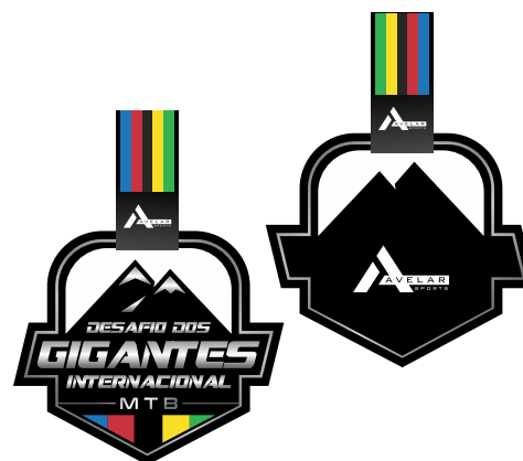
MEDALHA DE PARTICIPAÇÃO

- Troféu XCO CLASSE 1 - para os 5 primeiros colocados de cada uma das 31 categorias Individuais (155 troféus) Premiação em dinheiro para os 10 primeiros colocados de R$ 12.400,00, 000 dividido entre os 10 primeiro colocados da prova elite masculina e feminina XCO Cross Country.