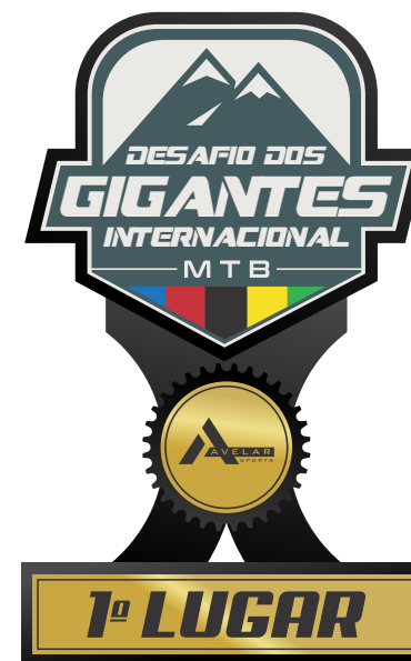
TROFÉU PARA OS 5 PRIMEIROS DE CADA CATEGORIA 2